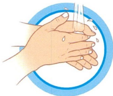
ЧАСТО МОЙТЕ РУКИ С МЫЛОМ