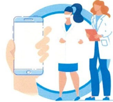
В СЛУЧАЕ ЗАБОЛЕВАНИЯ ОБРАЩАЙТЕСЬ К ВРАЧУ