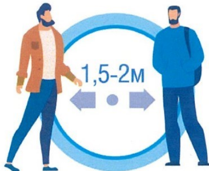
СОБЛЮДАЙТЕ РАССТОЯНИЕ И ЭТИКЕТ